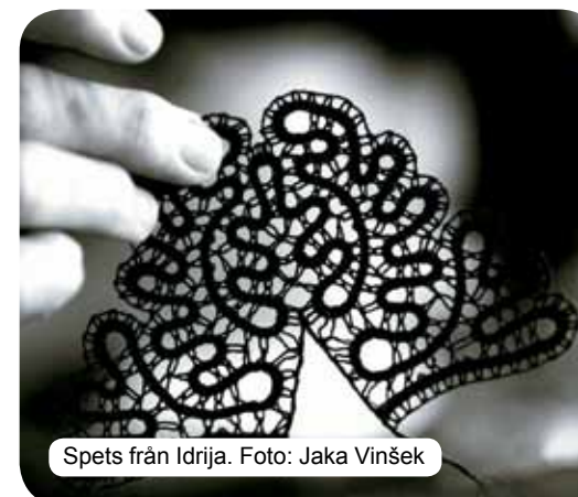
Spets från Idrija.