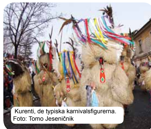
Kurenti, de typiska karnevalsfigurerna.

De kan skapa konst ur allting de älskar. Förutom konstnärer med olika förmågor och metoder som har gått i arv från generation till generation, är slovenerna också mycket framgångsrika inom många moderna konstformer för alla generationer. Kulturevenemangen är oerhört välbesökta – olika festivaler (speciellt under sommarmånaderna) berikar besökare från när och fjärran. Teater och konserter är populärt, slovenerna älskar att läsa och är stolta över sin kulturtradition. Här bör France Prešeren nämnas, en poet som blivit den slovenska poesins stolthet och som dessutom skrev Sloveniens nationalsång, Zdravljica. Sången väddar till samexistens mellan nationer och är en hyllning till alla godhjärtade människor.