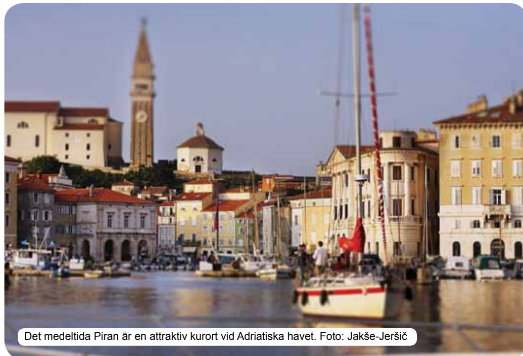
Det medeltida Piran är en attraktiv kurort vid Adriatiska havet.