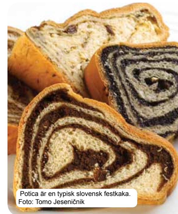
Potica är en typisk slovensk festkaka.

Traditionell slovensk mat baseras på spannmål, färska mjölkprodukter, kött, fisk, grönsaker, potatis, oliver och skinka. Beroende på region kan man också hitta influenser från landsbygden, städerna och olika klosterordnar. Slovenien har en enorm mångfald av viner som säkrar en gourmetupplevelse i toppklass. Verkliga njutningsmänniskor kan se fram emot varma källor, kurorter, turistfarmar och fantastiska restauranger.