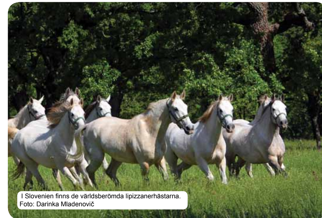
I Slovenien finns de världsberömda lipizzanerhästarna.