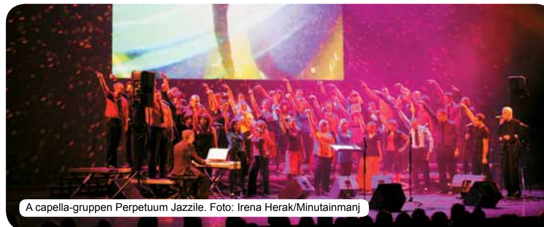
A capella-gruppen Perpetuum Jazzile.