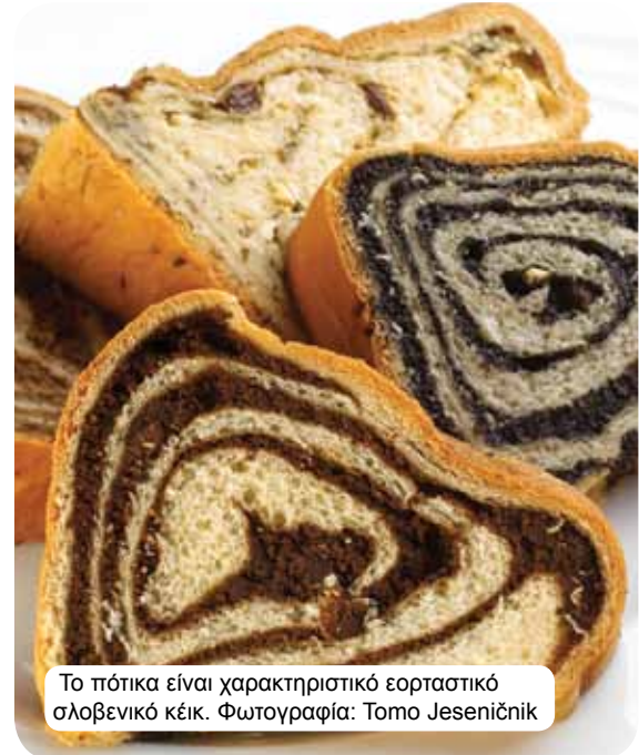
Το πότεικα είναι χαρακτηριστικό εορταστικό σλοβενικό κέικ.

Η γαστριμαργική εικόνα της σύγχρονης Σλοβενίας ενσωματώνει τις επιρροές κουλτούρας και πολιτισμού από τις περιοχές των Άλπεων, της Μεσογείου και της Παννονίας. Αιώνες ολόκληροι κοινωνικής και ιστορικής εξέλιξης σε αυτό το σταυροδρόμι έχουν δημιουργήσει συγκεκριμένους τύπους κουλτούρας και τρόπου ζωής, όχι με την έννοια της αφομοίωσης αλλά με την έννοια της δημιουργίας μιας μοναδικής, αυθεντικής ποικιλίας, που περιλαμβάνει τη γαστριμαργία. Η παραδοσιακή σλοβενική κουζίνα βασίζεται στα δημητριακά, τα φρέσκα γαλακτοκομικά, το κρέας, το ψάρι, τα λαχανικά, τις πατάτες, τις ελιές και τα αλλαντικά. Βεβαίως, ανάλογα με την περιοχή, αναμιγνύονται οι επιρροές της υπαίθρου, των πόλεων και των διάφορων ταγμάτων μοναχών. Σε συνδυασμό με την κουζίνα, η εξαιρετική ποικιλία των κρασιών της Σλοβενίας διασφαλίζει μια κορυφαία γκουρμέ απόλαυση. Οι απόλυτοι ηδονιστές μπορούν να προσμένουν θερμές πηγές και θέρετρα υγείας, τουριστικά αγροκτήματα και κορυφαίας κατηγορίας εστιατόρια.