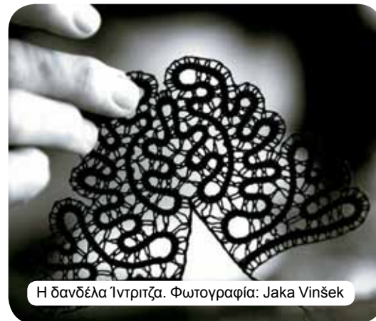
Η δανδέλα 'Intrizca'.