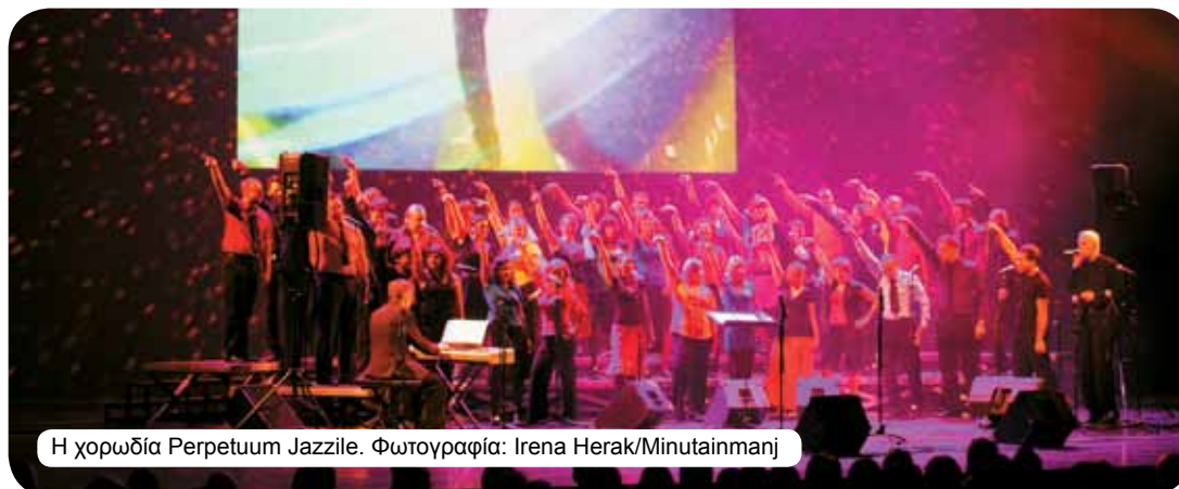
Η χορωδία Perpetuum Jazzile.