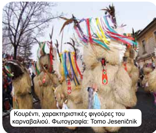
Κουρέντι, χαρακτηριστικές φιγούρες του καρναβαλιού.

τέχνη από οτιδήποτε αγαπούν. Εκτός από τους καλλιτέχνες με τις διάφορες δεξιότητες και τέχνες που έχουν κληροδοτηθεί από γενιά σε γενιά, οι Σλοβένοι είναι επίσης επιτυχημένοι σε πολλές σύγχρονες μορφές τέχνης προσβάσιμες σε όλες τις γενιές. Οι πολιτιστικές εκδηλώσεις έχουν απίστευτα μεγάλο κοινό – διάφορα φεστιβάλ (ιδίως τους καλοκαιρινούς μήνες) συναρπάζουν τους επισκέπτες που φθάνουν από κοντά και μακριά. Το θέατρο και οι συναυλίες είναι δημοφιλείς ενώ οι Σλοβένοι λατρεύουν το διάβασμα και είναι περήφανοι για την πολιτιστική παράδοσή τους. Θα πρέπει να αναφέρουμε τον Φρανκ Πρεσερν, έναν ποιητή που έγινε το καύχημα της σλοβενικής ποίησης και συγγραφέας του σλοβενικού εθνικού ύμνου, Zdravljica. Ο ύμνος κάνει έκκληση για τη συνύπαρξη των εθνών και αποτελεί zdravlje, ή μια πρόποση, σε όλους τους καλόθιμους ανθρώπους.