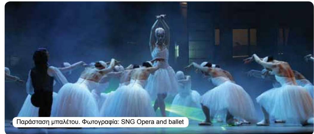
Παράσταση μπαλέτου.