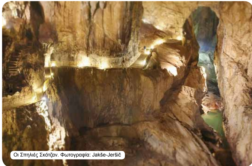
Οι Σπηλιές Σκότζαν.