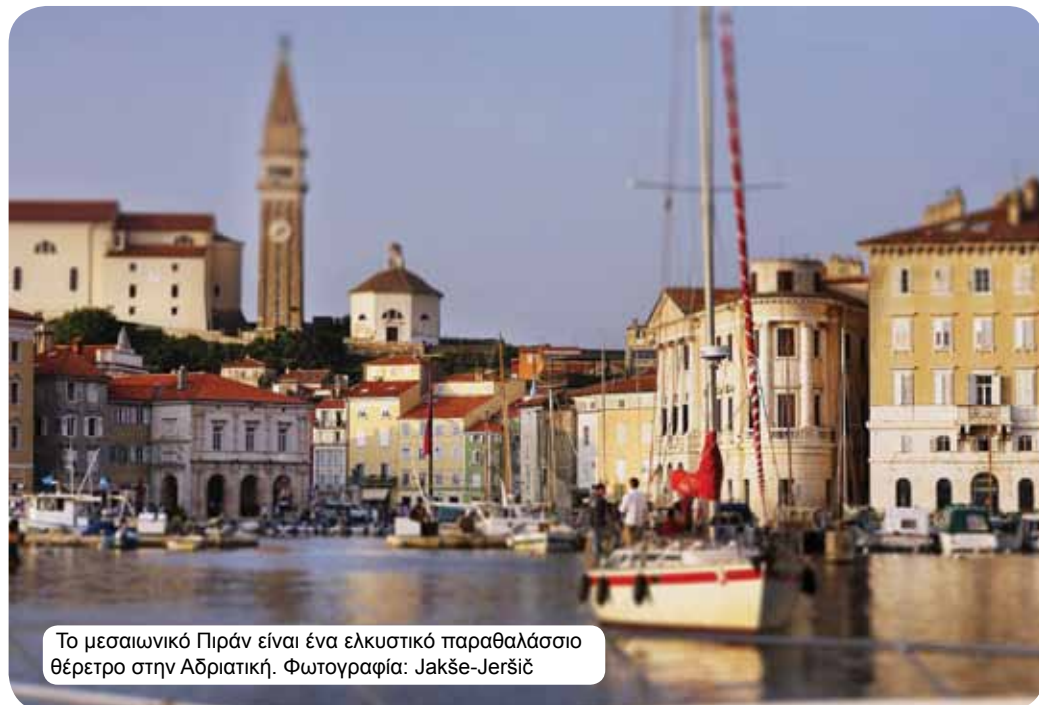
Το μεσαιωνικό Πιράν είναι ένα ελκυστικό παραθαλάσσιο θέρετρο στην Αδριατική.