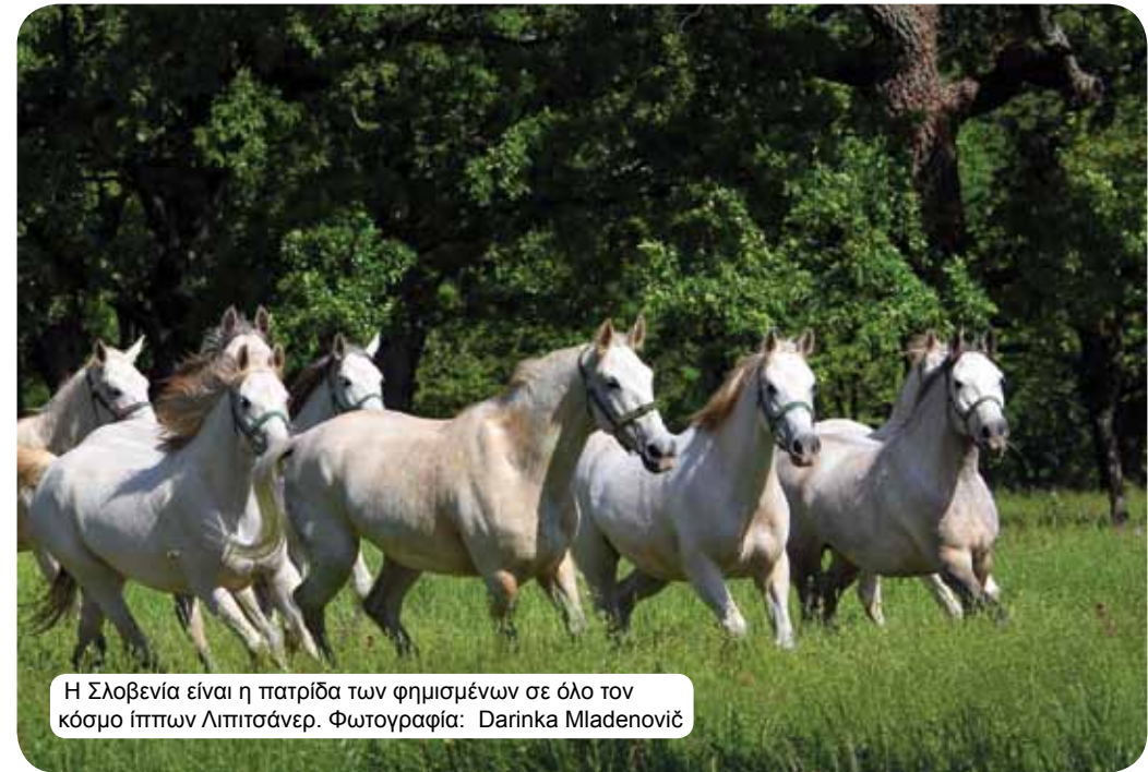
Η Σλοβενία είναι η πατρίδα των φημισμένων σε όλο τον κόσμο ίππων Λιπιτσάνερ.