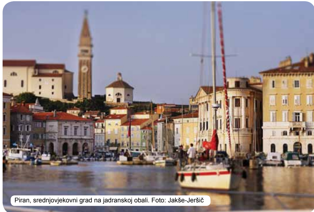
Piran, srednjovjekovni grad na jadranskoj obali.

Slovenija se predstavlja nacionalnom markom »I feel Slovenia« koja se zasniva na zelenoj boji jer više od polovine države pokrivaju šume. Odražava uravnoteženost između prirode i marljivosti Slovenaca i govori o netaknutoj prirodi i želji da je kao takvu i očuvamo. Šume pokrivaju više od polovine države. Zelena boja u Sloveniji je zaista dominantna – »slovenačka zelena« koja odražava ravnotežu između smirenosti prirode i marljivosti Slovenaca. Potvrđuje netaknutost prirode i naše opredjeljenje da takva i ostane. Simbolizuje uravnoteženost životnog stila koji objedinjava prijatnu uznemirenost koja prati Slovence u ispunjavanju njihovih ličnih želja uz zajedničku viziju da idu dalje ukorak sa prirodom. Slovenačka zelena takođe opisuje usmjerenost Slovenaca u elementarno, u ono što osjećaju sopstvenim rukama. Slovenačka zelena ujedno govori o skladu svih čula kojima Slovenija može da se doživi. Zato se Slovenije nikada nećemo prisjetiti kao slike, jer sjećanja na Sloveniju sjedinjuju miris šume, žubor potoka, iznenađujući ukus vode i toplinu drveta. Sloveniju osjećamo.