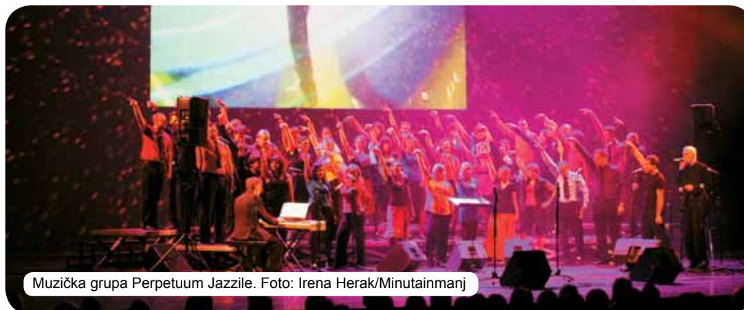
Muzička grupa Perpetuum Jazzile.