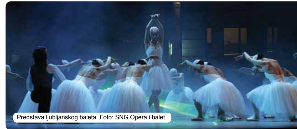
Predstava ljubljanskog baleta.