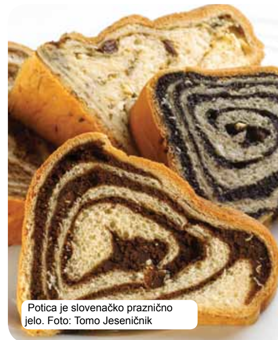
Potica je slovenačko praznično jelo.

Tradicionalna slovenačka kuhinja zasniva se na žitaricama, svježim mliječnim proizvodima, mesu, ribama, povrću, maslinama i pršutu. Zavisno od regiona objedinjava uticaje seoskih i gradskih sredina i različitih monaških redova. Vrhunska gurmanska zadovoljstva obezbjeđuje kako kulinarska slika tako i raznolikost slovenačke vinske karte. One najprobirljivije također očekuju termalna vrela i banje, ponuda seoskog turizma i vrhunski restorani.