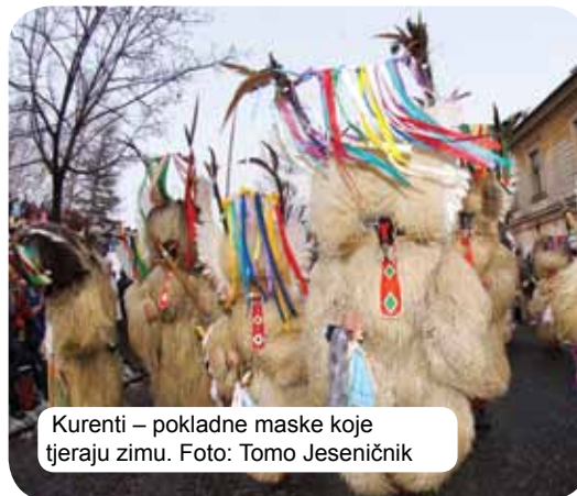
Kurenti – pokladne maske koje tjeraju zimu.

Kulturne priredbe su izuzetno dobro posjećene – različiti festivali (posebno u ljetnim mjesecima) oduševljavaju posjetioce koji dolaze iz svih krajeva. Omiljene su pozorišne predstave i koncerti, a osim toga volimo čitati i ponosni smo na svoju kulturnu baštinu. Ovdje takođe treba pomenuti Franceta Prešerna, pjesnika i autora slovenačke himne »Zdravljica« koji je postao ponos slovenačke poezije. Himna poziva na suživot naroda i predstavlja zdravicu svim ljudima dobrog srca.