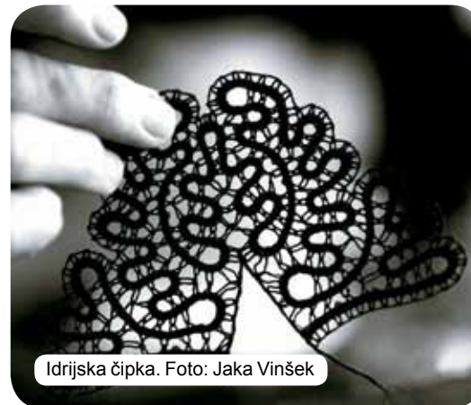
Idrijska čipka.