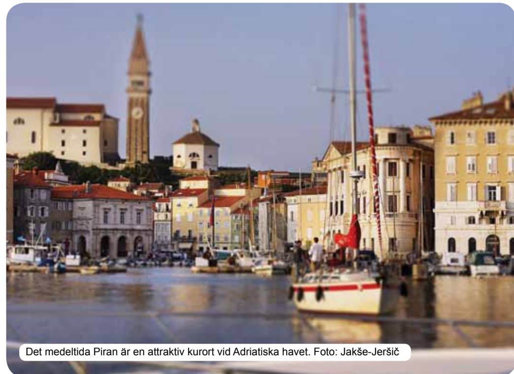
Det medeltida Piran är en attraktiv kurort vid Adriatiska havet.

I FEEL SLOVENIA är en slogan som i sig speglar essensen av Slovenien: ett land i vilket alla som besöker det, blir kära i.