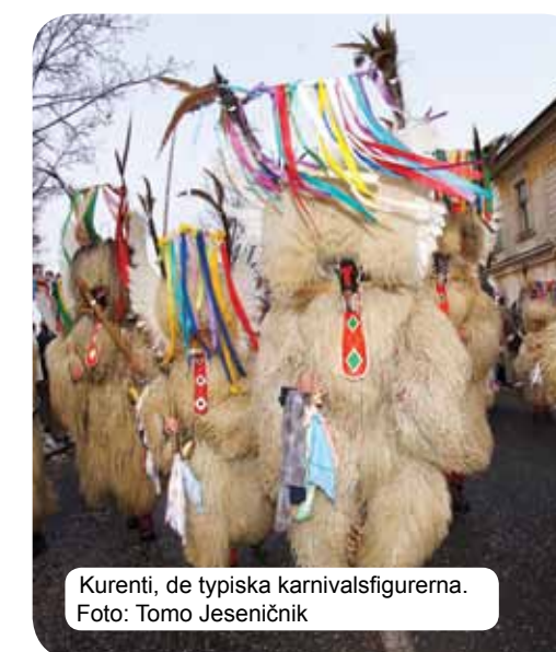
Kurenti, de typiska karnivalfigurer.

Kulturevenemangen är otroligt välbesökta - olika festivaler (särskilt under sommartid) gläder många besökare som kommer från när och fjärran. Det är populärt med teater och konserter, slovenerna tycker mycket om att läsa och är stolta över sitt kulturarv. Nämnas bör även France Prešeren, en poet som är den slovenska poesins stolthet och även författare av den slovenska nationalsången "Zdravljica". Denna efterlyser samlevnad mellan människor och är en hyllning till alla med gott hjärta.