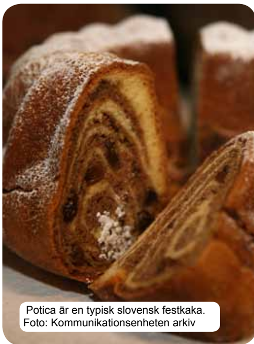
Potica är en typisk slovensk festkaka.

Den kulinariska bilden av det moderna Slovenien påverkas av influenser från kulturen och de olika områdena i Alperna, Medelhavsområdet samt de Pannoniska regionerna. Århundraden av social och historisk utveckling har skapat en viss typ av livsstil, inte i betydelsen av assimilering, utan snarare skapandet av en unik och historisk mångfald även inom den kulinariska konsten. Traditionella slovenska rätter är baserade på spannmål, färska mejeriprodukter, kött, fisk, grönsaker, potatis, oliver och parmaskinka. Beroende på region kombineras naturligtvis influenserna i området, befolkningen och även olika munkordnar. Förutom det kulinariska utbudet finns även ett enastående utbud av slovenska viner som säkerställer utmärkta gourmetupplevelser.