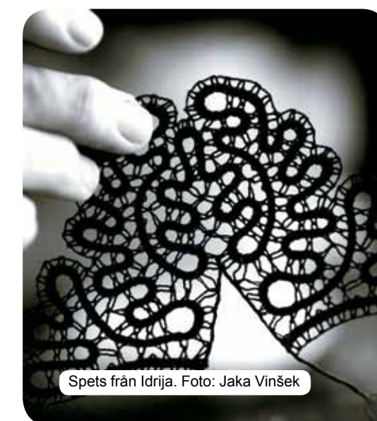
Spets från Idrija.