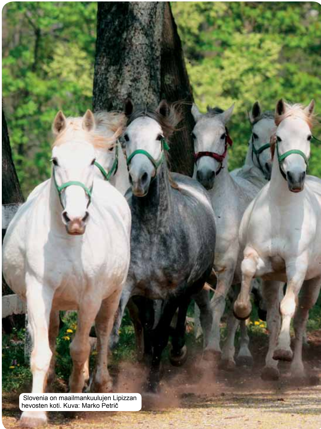
Slovenia on maailmankuulujen Lipizzan hevosten koti.