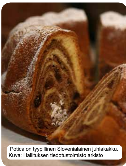
Potica on tyypillinen Slovenialainen juhkakakku.

Slovenian nykyaikainen ruokakulttuuri heijastaa kulttuurin ja sivistyksen vaikutteita Karpaattien, Välimeren ja Alppien alueilta. Vuosisatojen yhteiskunnallinen ja historiallinen kehitys tässä risteyksessä ovat luoneet tietynlaisen elämäntavan. Kyse ei ole mukautumisesta, vaan ainutlaatuisesta ja historiallisesta monimuotoisuudesta, johon ruokakulttuuri kuuluu osa-alueena. Perinteiset slovenialaiset ruoat perustuvat viljoihin, tuoreisiin maitotuotteisiin, lihaan, kalaan, vihanneksiin, perunaan, oliiviin ja prosciuttoon. Alueesta riippuen ne yhdistävät maaseudun ja porvariston vaikutuksia. Kulinaarisen herkkujen lisäksi Slovenian viinilistan poikkeuksellinen monimuotoisuus takaa myös erinomaisia gourmet -nautintoja.