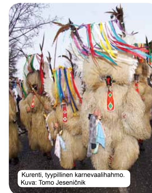
Kurentti, tyypillinen karnevaalilahmo.

Kulttuuritapahtumiin osallistuu erittäin paljon ihmisiä. Eri festivaalit (etenkin kesällä) ilahduttavat sekä kaukaa että läheltä tulevia kävijöitä. Todella suosittuja ovat myös teatterit ja konsertit. Sen lisäksi slovenialaiset ovat todella ylpeitä kulttuuriperinnöstä ja pitävät lukemisesta. Erytisen mainitsemisen arvoinen runoilija on France Prešerenea, joka kirjoitti slovenialaisen kansallislaulun Zdravljican (suom. Maljalaulu), joka tuo esiin sloveenien isänmaanrakkauden ja vapauden kaipuun.