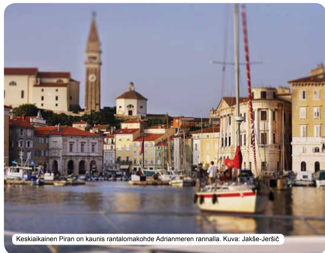
Keskiaikainen Piran on kaunis rantalomakohde Adrianmeren rannalla.

Karpaattien allasta ja merta. Entä mitä matkustajat pitävät Sloveniasta eniten? Ensinnäkin kuuluu, että Slovenia on erittäin miellyttävä maa, joka rauhoittaa henkeä ja virkistää kehon, erityisesti koska sen koskemattoman luonnon, leudon ilmaston, vieraanvaraisuuden, ystävällisten ihmisten ja kylpylöiden ja kuumien lähteiden takia. Slovenian kauneus tunnetusti on myös sen arvojen runsaassa monipuolisuudessa, mikä on seurausta ihmisen ja luonnon vuosisatojen pituisen vuorovaikutuksen tulosta. Slovenia on moderni ja turvallinen maa. I FEEL SLOVENIA on iskulause, joka jo itse kertoo paljon. Slovenia on maa, johon rakastuu jokainen, joka sinne matkustaa.