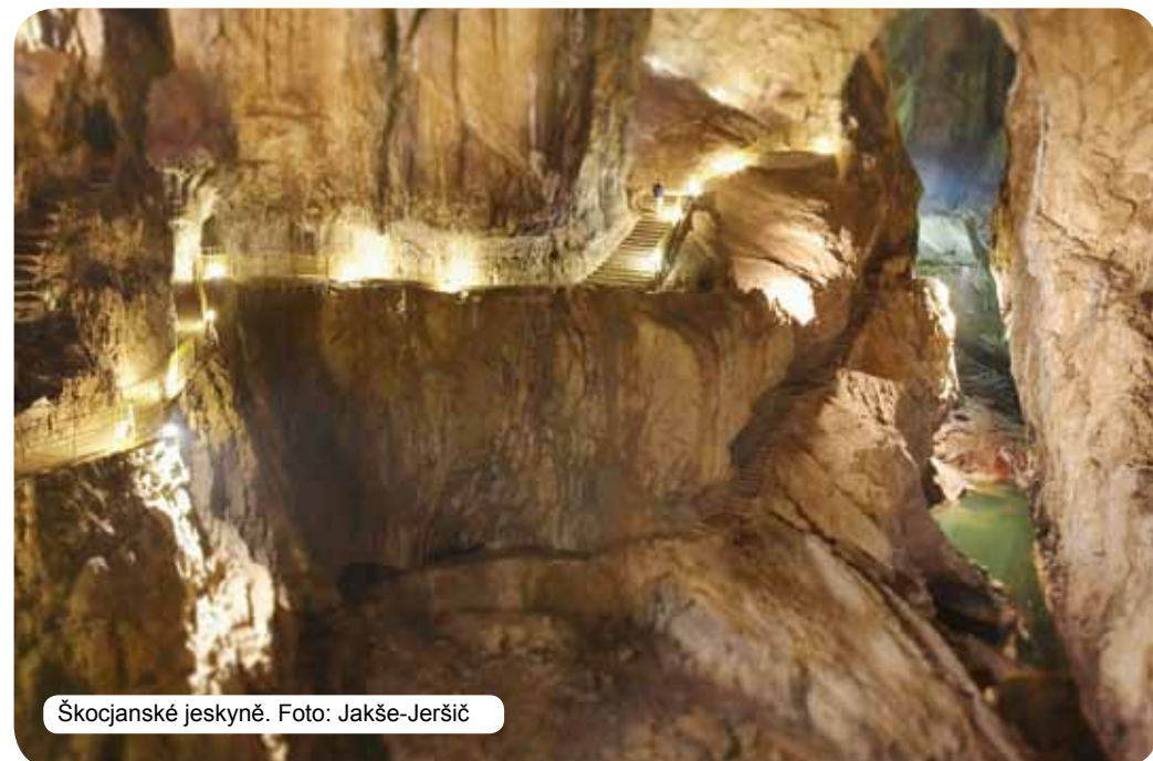
Skocjanske jeskyně.