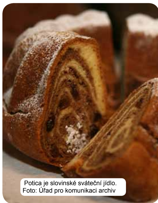
Potica je slovinské sváteční jídlo.

V závislosti na regionu, sdružuje samozřejmě vliv venkova, měšťanů a různých mnišských řádů. Kromě kulinářské nabídky zaručuje vrcholné gurmánské zážitky také vyjimečně pestrá nabídka slovinských vín.