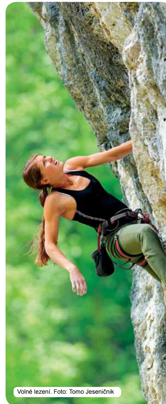
Volné lezení.

Od roku 1991 se Slovinsko aktivně zapojuje do programů výzkumu a vývoje EU a do jiných evropských programů z této oblasti, doposud spolupracovalo ve více než v tisíci projektech evropských výzkumných rámcových programů.