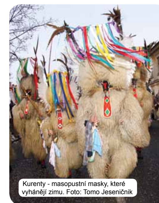
Kurenty - masopustní masky, které vyhánějí zimu.

městech ve státech, ale prakticky v každém koutku Slovinska. Téměř každý Slovinec je sám o sobě básník, malíř, kuchař, tanečník, vinař, muzikant, režisér, herec, blogger, řezbář. Ze všeho, co miluje, umí udělat umění. Kromě umělců různých ručních prací a řemesel, která se již přes století přenášejí z generace na generaci, jsou Slovinci úspěšní také v mnoha soudobých uměních, přístupných všem generacím. Kulturní akce jsou neuvěřitelně dobře navštěvovány – různé festivaly (hlavně v letních měsících) nadchnou návštěvníky, kteří přicházejí zblízka i zdaleka. Oblíbená jsou divadla, koncerty, Slovinci rádi čtou a jsou pyšní na svoji kulturní tradici. Zmínit můžeme France Prešernu, básníka, který se stal pýchou slovinské poezie a je autorem slovinské hymny Zdravljice. Ta vyzývá k soužití národů a je oslavou všech lidí dobrého srdce.