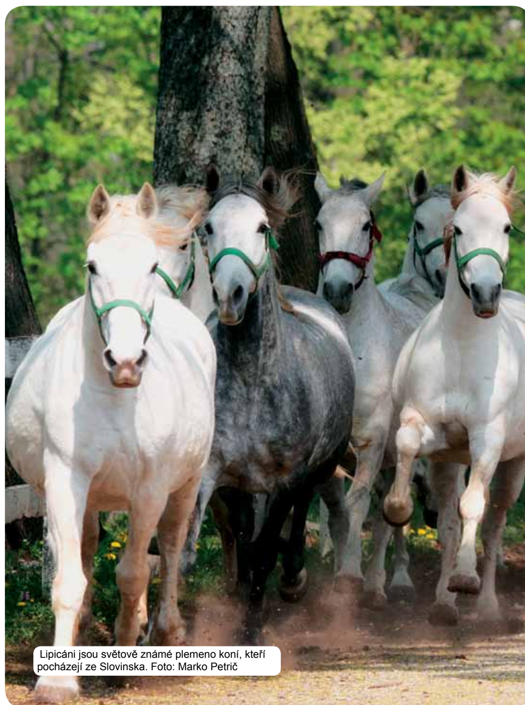
Lipicáni jsou světově známé plemeno koní, kteří pocházejí ze Slovinska.