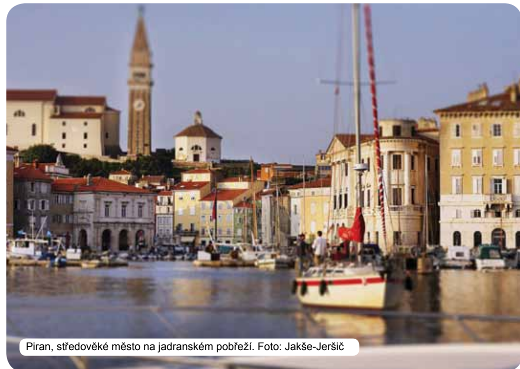
Piran, středověké město na jadranském pobřeží.

I FEEL SLOVENIA je slogan, který v sobě odráží podstatu Slovinska: země, do které se zamiluje každý, který ji navštíví.