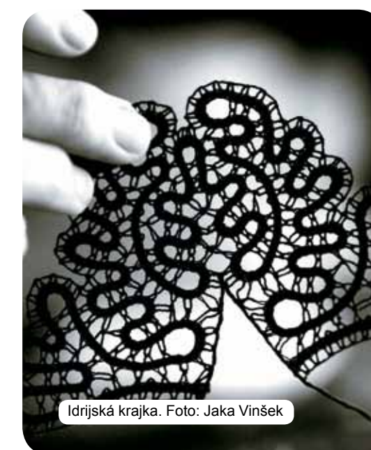
Idrijská krajka.