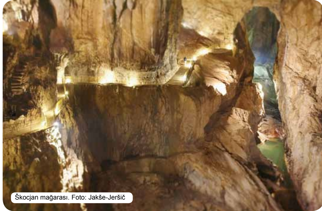
Škocjan mağarası.