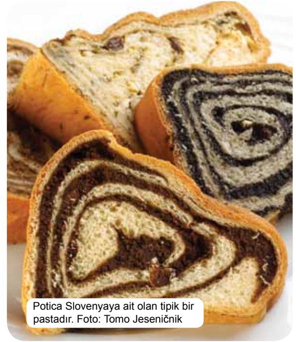
Potica Slovenyaya ait olan tipik bir pastadır.

Günümüz Sloven mutfağı Alpler, Akdeniz ve Pannonian bölgelerden kültürlerin ve medeniyetlerin izlerini taşımaktadır. Bu kavşak noktasında meydana gelen yüzlerce yıllık sosyal ve tarihsel gelişim, asimilasyon anlamında değil, fakat mutfak kültürü de dâhil olmak üzere eşsiz ve orijinal bir çeşitlilik yaratma anlamında belirli bir kültür ve yaşam tarzı formu meydana getirmiştir. Geleneksel Sloven mutfağı hububat, taze süt ürünleri, et, balık, sebze, patates, zeytin ve jambona dayanmaktadır. Elbette bölgeye bağlı olarak, kırsal kesim, şehir ve çeşitli manastır tabakalarının etkilerini birleştirmektedir. Mutfağının yanı sıra, Slovenya'nın olağanüstü şarap yelpazesi çeşitliliği en iyi gurmelerin damak tadına hitap etmektedir. İyi ve keyifli yaşamayı sevenler, termal su kaynakları ve sağlık merkezleri, turistik çiftlikler ve birinci sınıf restoranları deneyebilirler.