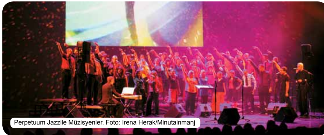
Perpetuum Jazzile Müzisyenler.