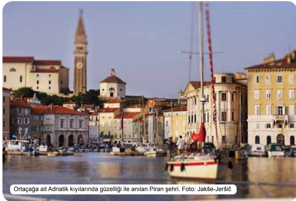
Ortaçağa ait Adriatik kıyılarında güzelliği ile anılan Piran şehri.