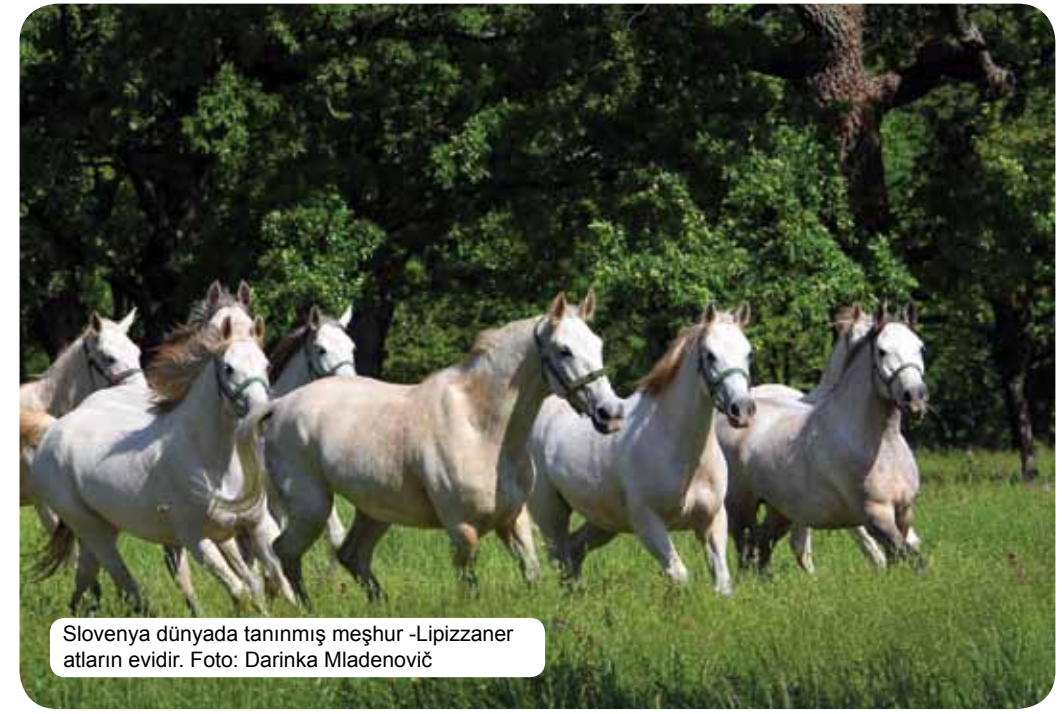
Slovenya dünyada tanınmış meşhur -Lipizzaner atların evidir.