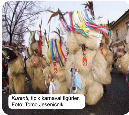
Kurenti, tipik karnaval figürler.

her şey ile ilgili nasıl sanat yaratacaklarını bilirler. Nesilden nesile aktarılan çeşitli beceri ve el sanatlarına sahip sanatçıların yanı sıra Slovenler ayrıca, tüm nesillerin erişimine açık olan birçok modern sanat formunda da başarılıdırlar. Kültürel etkinliklere katılım oldukça fazladır ve çeşitli festivaller (özellikle yaz aylarında), yakın ve uzak mesafelerden gelen ziyaretçileri heyecanlandırır. Tiyatro ve konserler popülerdir; Slovenler okumayı sever ve kültürel gelenekleri ile gurur duyarlar. Yeri gelmişken Sloven şiirinin gururu olan ve Slovenya milli marşı Zdravljica'nın yazarı olan şair Fransa Prešeren'den bahsetmemiz gerekir. Marş, ulusların birlik olmaları için çağrı yapar ve tüm iyi kalpli insanlara kadeh yani bir zdravljica kaldırır.