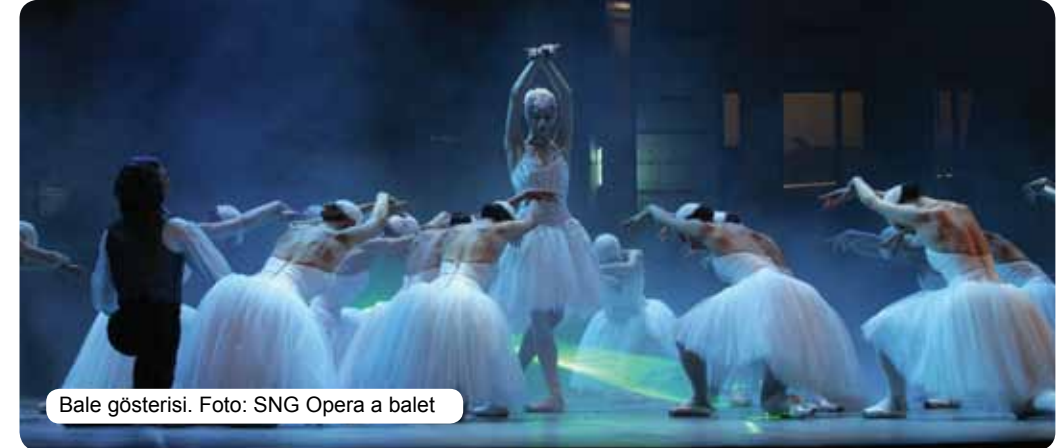
Bale gösterisi.