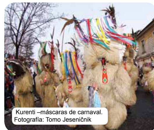
Kurenti – máscaras de carnaval.

dançarino, vinicultor, músico, diretor, ator, realizador, escritor de blog. Consegue fazer arte de tudo o que ama. Além de artistas de mais variados artesanatos que durante séculos foram transmitidos de uma geração a outra, os eslovenos distinguem-se na arte moderna, acessível a todas as gerações. Os eventos culturais geralmente atraem uma audiência considerável – diferentes festivais entusiasma aos visitantes e amadores de arte de perto e de longe. Teatro e concertos são muito populares. Os eslovenos adoram ler e orgulham-se muito da sua cultura. Convém destacar ao France Prešeren, o poeta e o orgulho da poesia eslovena, autor do hino nacional esloveno intitulado O Brinde. Nesse poema, o poeta apela à convivência de todos os povos, ao convívio de todas as nações, brindando por toda a gente de bom coração e alma pura.