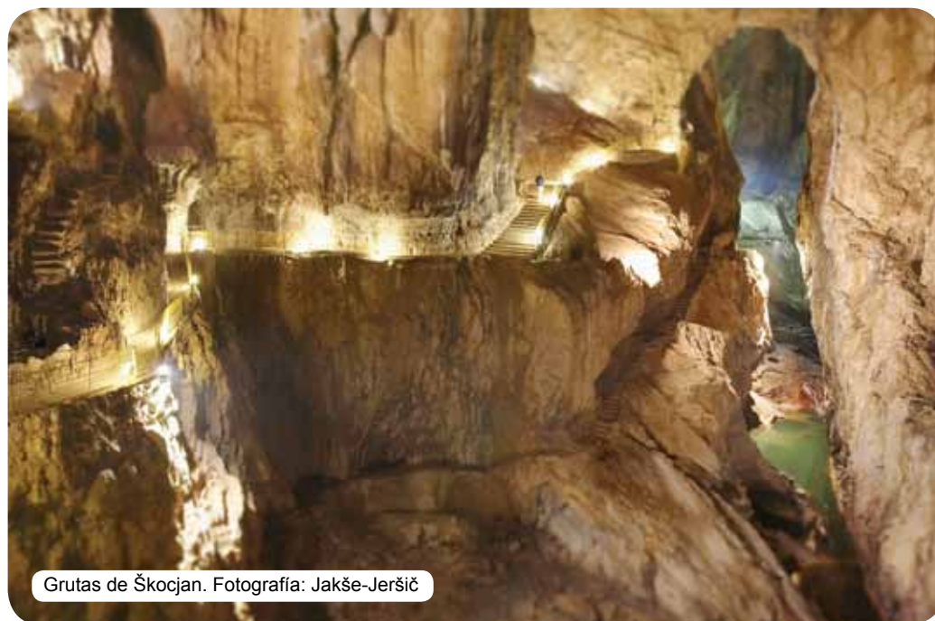
Grutas de Škocjan.