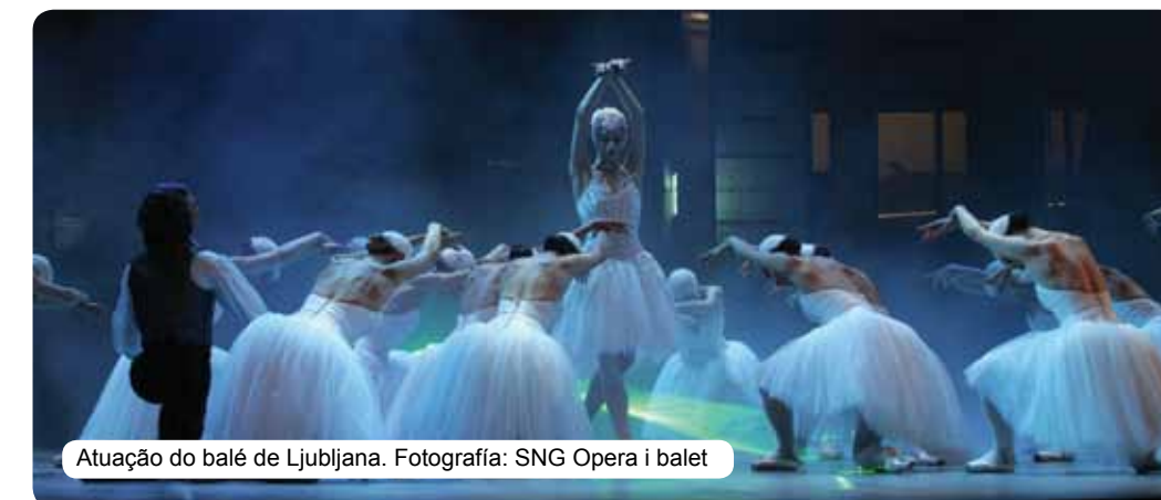
Atuação do balé de Ljubljana.