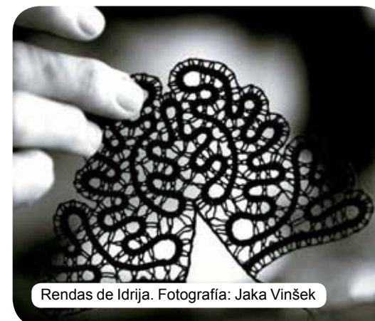
Rendas de Idrija.