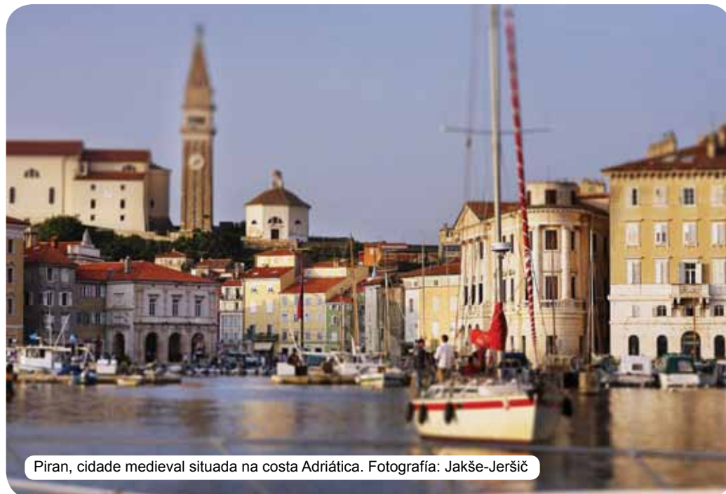
Piran, cidade medieval situada na costa Adriática.