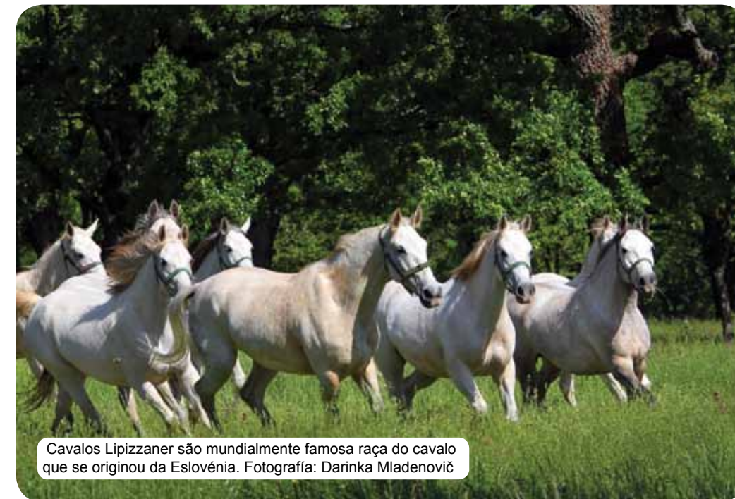
Cavalos Lipizzaner são mundialmente famosa raça do cavalo que se originou da Eslovênia.