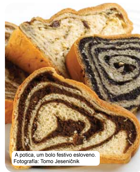
A potica, um bolo festivo esloveno.

A cozinha tradicional eslovena baseia-se em cereais, produtos lácteos frescos, carne, peixe, verdura, batata, azeitonas e presunto. É natural que as variantes da culinária dependam da região, contudo, dependem também das influências do campo, burguesia e distintas ordens religiosas. Além da oferta culinária, também a grande diversidade do cardápio de vinhos eslovenos garante grandes prazeres ao paladar. Os turistas mais hedonistas podem acrescentar à lista dos prazeres também o gosto de aproveitar as águas termais, a oferta das fazendas turísticas e os numerosos restaurantes de prestígio.