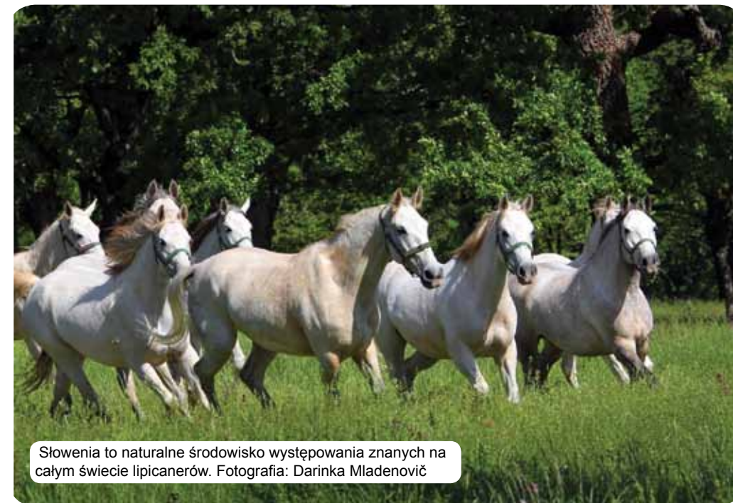
Słowenia to naturalne środowisko występowania znanych na całym świecie lipicanerów.