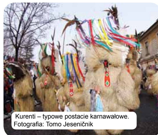
Kurenti – typowe postacie karnawałowe.

W wydarzeniach kulturalnych bierze udział mnóstwo osób – wszelkiego rodzaju festiwale (organizowane głównie w miesiącach letnich) przyciągają gości z bliska i daleka. Popularne są teatry i koncerty a Słoweńcy uwielbiają czytać i są dumni ze swojej tradycji kulturowej. Dość wspomnieć poetę okresu Romantyzmu France'a Prešerna, który jest uważany za chlubę narodowej poezji. Słowa napisanej przez niego pieśni Zdravljica stały się słowami hymnu narodowego niepodległej Republiki Słowenii. Słowa hymnu wzywają do pokojowego współistnienia narodów i nie bez kozery nosi on tytuł Zdravljica; jest to Toast wznoszony przez przyjaciół na cześć wszystkich ludzi dobrej woli.