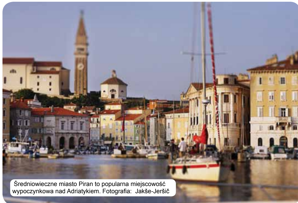
Średniowieczne miasto Piran to popularna miejscowość wypoczynkowa nad Adriatykiem.