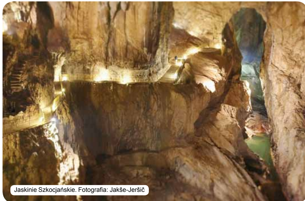
Jaskinie Szkocjańskie.