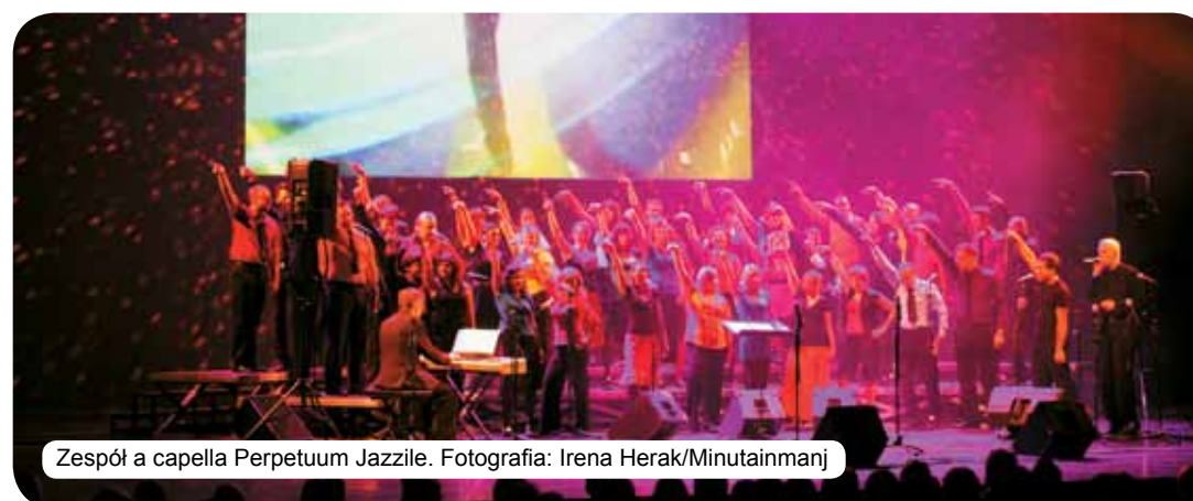
Zespół a capella Perpetuum Jazzile.