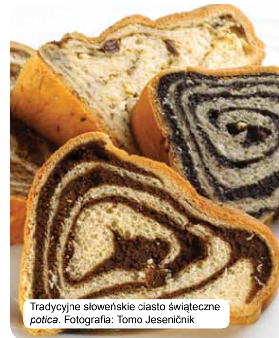
Tradycyjne słoweńskie ciasto świąteczne potica.

Tradycyjna kuchnia słoweńska opiera się na zbożach, świeżym nabiale, mięsie, rybach, warzywach, ziemniakach, oliwkach oraz wędzonej szynce. Kuchnia może posiadać elementy typowe dla danego regionu, a więc wsi, miasta bądź klasztoru. Słowenia może się również poszczycić ogromnym wyborem znakomitej jakości win. Hedoniści mogą zażywać kąpeli w gorących źródłach i wypoczywać w uzdrowiskach, gospodarstwach agroturystycznych, a także stołować się w najlepszych restauracjach.