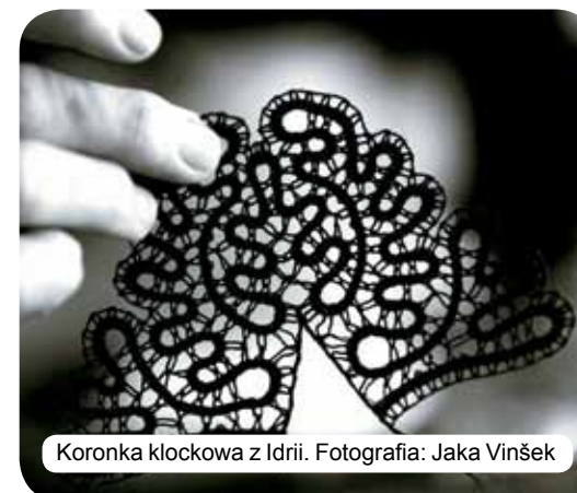
Koronka klockowa z Idrii.