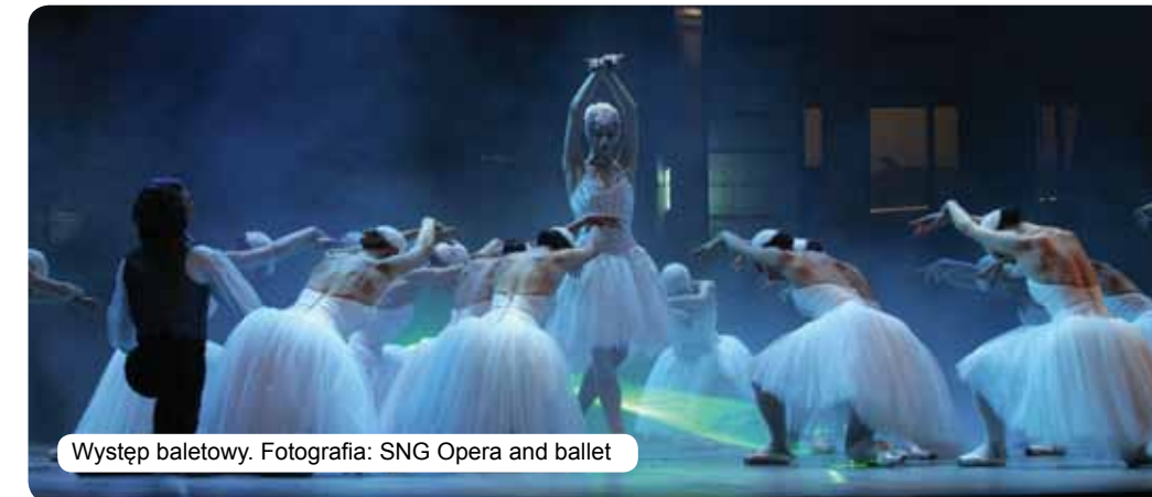
Występ baletowy.