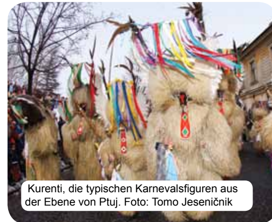
Kurenti, die typischen Karnevalsfiguren aus der Ebene von Ptuj.

allem was er liebt, kann er Kunst formen. Neben den Künstlern verschiedener Handfertigkeiten und Handwerke, die schon seit Jahrhunderten von einer Generation in die nächste überliefert werden, sind Slowenen auch erfolgreich in zahlreichen modernen Kunstarten, die allen Generationen zugänglich sind. Die Kulturveranstaltungen sind gut besucht – verschiedene Festivals (insbesondere in den Sommermonaten) begeistern Besucher von Nah und Fern. Sehr beliebt sind das Theater und Konzerte. Wir lesen gerne und sind stolz auf unsere kulturelle Überlieferung. Zu erwähnen ist der Dichter France Prešeren, der der Stolz der slowenischen Poesie und Autor der slowenischen Nationalhymne Zdravljica ist. Unsere Nationalhymne ruft zum nachbarlichen Frieden auf und ist ein Trinklied für alle gutherzigen Menschen.