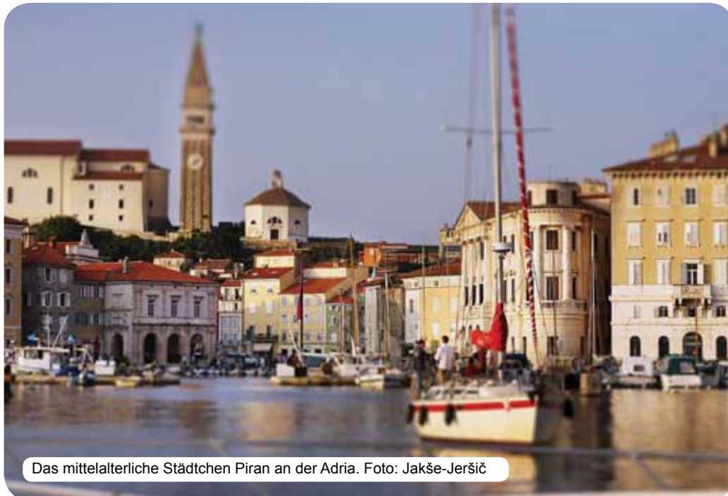
Das mittelalterliche Städtchen Piran an der Adria.