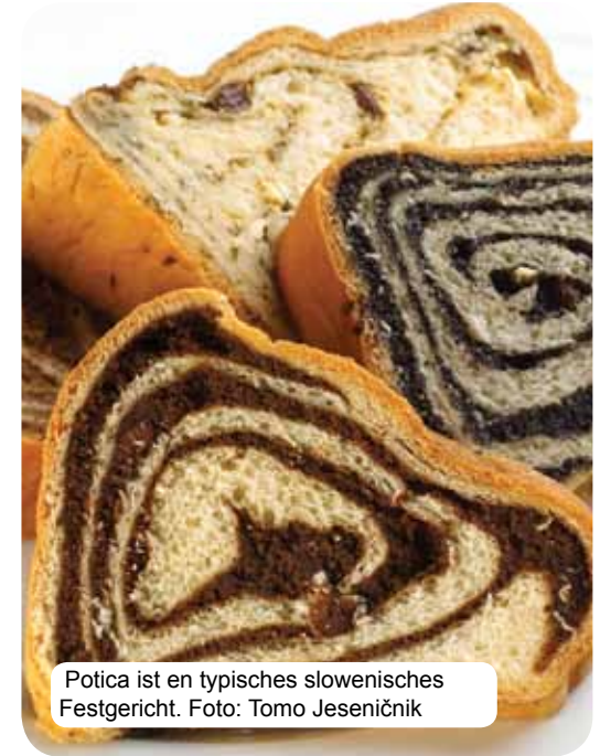
Potica ist ein typisches slowenisches Festgericht.

Die slowenische Küche des modernen Sloweniens wurde stark von der Kultur und den Bewohnern der Alpen, des Mittelmeerraums und der Pannonischen Tiefebene beeinflusst. Jahrhunderte der gesellschaftlichen und geschichtlichen Entwicklung schufen an diesem Berührungspunkt besondere Kulturarten und Lebensstile, jedoch nicht im Sinne einer Anpassung, sondern in Sinne der Schaffung einer einzigartigen und originellen Mischung, die sich auch in der slowenischen Küche widerspiegelt. Die traditionelle slowenische Küche basiert auf Getreide, frischen Milcherzeugnissen, Fleisch, Fischen, Gemüse, Kartoffeln, Oliven und der kraški pršut. Von der Region abhängig vereinigt sie die Einflüsse der Landgegenden, Städte und verschiedener Mönchsorden. Neben dem kulinarischen Angebot bieten die abwechslungsreichen Weinkarten Gourmetfreunden der Extraklasse. Die Genießer erwarten auch die Thermalbäder und Kurorte, das Angebot der touristischen Bauernhöfe und Spitzenrestaurants.