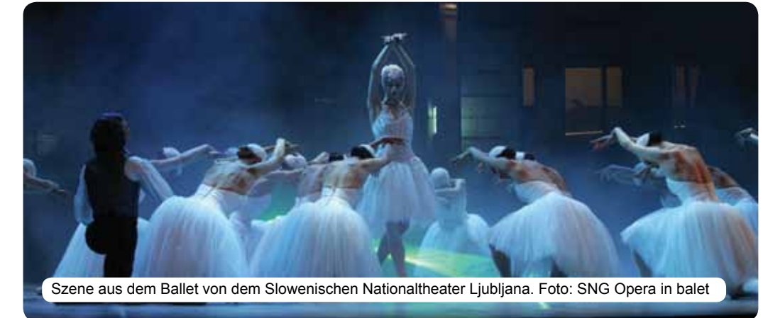
Szene aus dem Ballet von dem Slowenischen Nationaltheater Ljubljana.