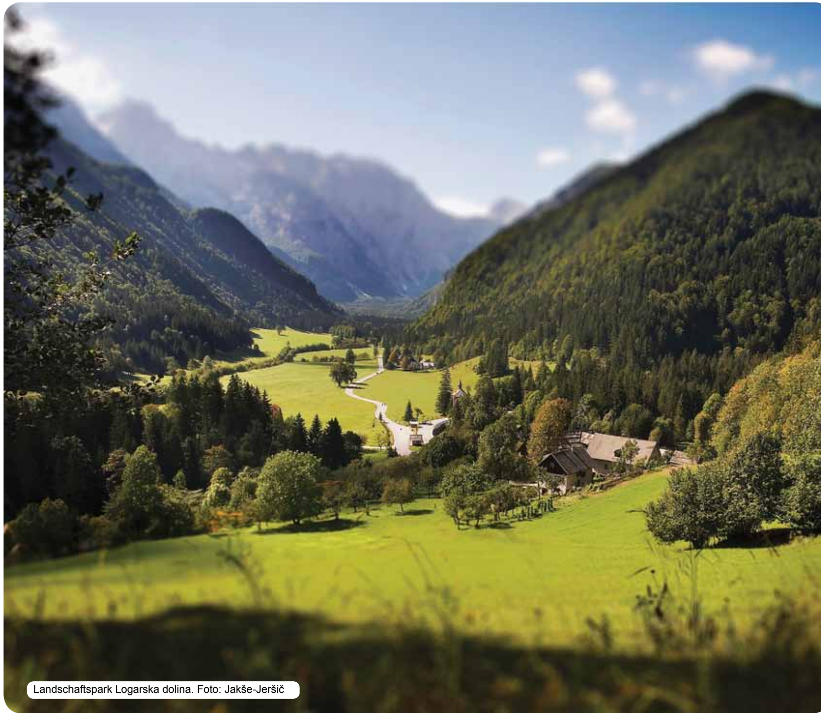
Landschaftspark Logarska dolina.

In Slowenien gibt es über 2000 Sonnenstunden im Jahr und somit bietet jede Jahreszeit einen erholsamen Urlaub. Es gibt zahlreiche schöne Orte für jeden Geschmack, auch für die besonders anspruchsvollen Gäste. Golfplätze, Skigebiete, verschiedene Sportkapazitäten, Adrenalin sport und andere sportliche Aktivitäten begeistern auch die besonders anspruchsvollen Sportfans. Zur Verfügung stehen auch Radsport, Bergsteigen, Extremsportarten und verschiedene Freizeitveranstaltungen. Was gefällt den Besuchern besonders an Slowenien? Zuerst folgen Ausdrücke der Begeisterung. Es folgen Antworten wie zum Beispiel, dass Slowenien ein angenehmes Land ist, das den Geist beruhigt und den Körper belebt, insbesondere wegen seiner unberührten Natur, dem milden Klima, der Gastfreundschaft, der freundlichen Menschen und den zahlreichen Thermalquellen. Sie fügen gerne hinzu, dass die Größe Sloweniens gerade in der Vielfältigkeit und den Werten, die in Jahrhunderte langer Mitwirkung zwischen Mensch und Natur entstanden sind, liegt und dass Slowenien ein geordneter, moderner und sicherer Staat ist. Es gibt keinen Grund dem keinen Glauben zu schenken.