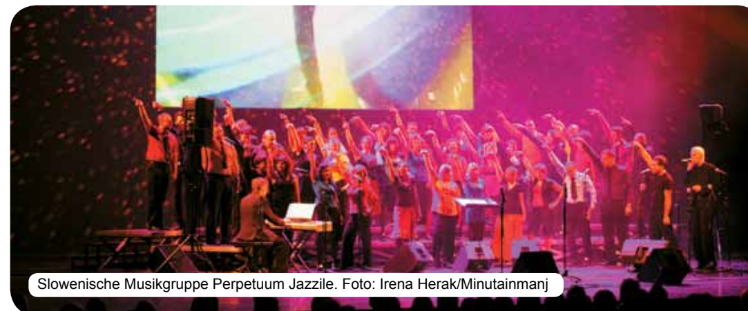
Slowenische Musikgruppe Perpetuum Jazzile.