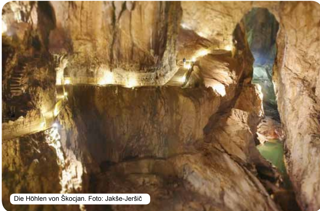
Die Höhlen von Škocjan.