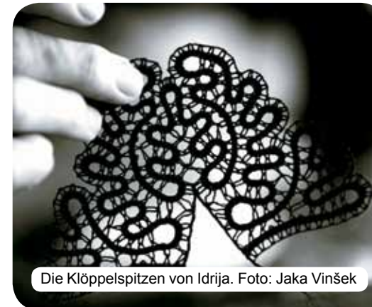
Die Klöppelspitzen von Idrija.