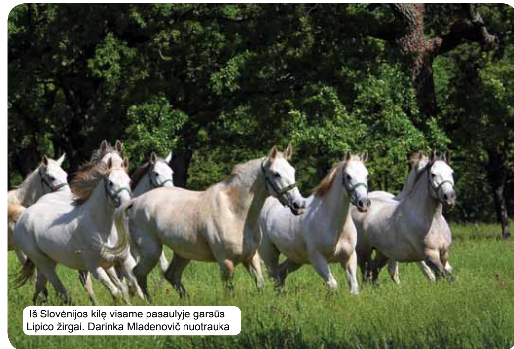
Iš Slovėnijos kilę visame pasaulyje garsūs Lipico žirgai.