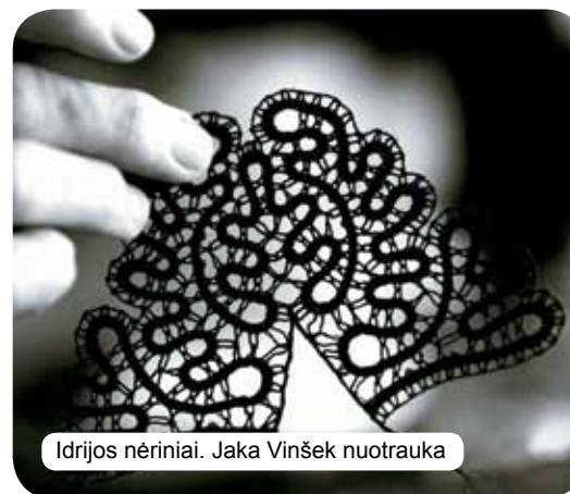
Idrijos nėriniai. Jaka Vinšek nuotrauka