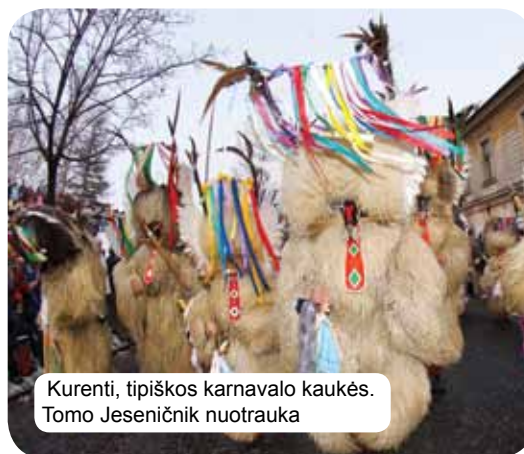
Kurenti, tipiškos karnavalo kaukės.

Neįtikėtina didelis kultūrinių renginių lankomumas – lankytojus iš arti ir iš toli vilioja įvairūs festivaliai (ypač vasarą). Populiarus teatras ir koncertai, be to, slovėnai labai mėgsta skaityti ir didžiuojasi savo kultūros tradicijomis. Turėtume paminėti France Prešereną – poetą, kuris tapo slovėnų poezijos pasididžiavimu ir parašė Slovėnijos tautinį himną Zdravljica. Himne išaukštinama tautų draugystė, tai yra Zdravljica (tostas) visiems geros širdies žmonėms.