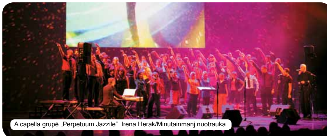
A capella grupė „Perpetuum Jazzile“.