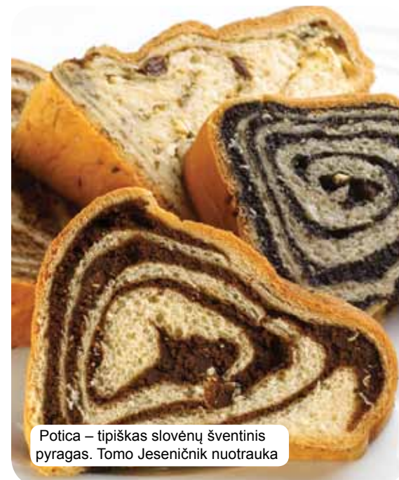
Potica – tipiškas slovėnų šventinis pyragas.

Tradicinės slovėnų virtuvės pagrindas – grūdai, švieži pieno produktai, mėsa, žuvis, daržovės, bulvės, alyvuogės ir sūdytas kumpis. Žinoma, atskiruose regionuose justi kaimo, miesto ir įvairių vienuolių ordinų įtaka. Kaip ir virtuvė, išskirtinė slovėniškų vynų įvairovė garantuoja gurmaniškiausius malonumus. Didžiausi hedonistai teieško terminų šaltinių ir sveikatinimo kurortų, turistinių sodybų ir aukščiausios klasės restoranų.