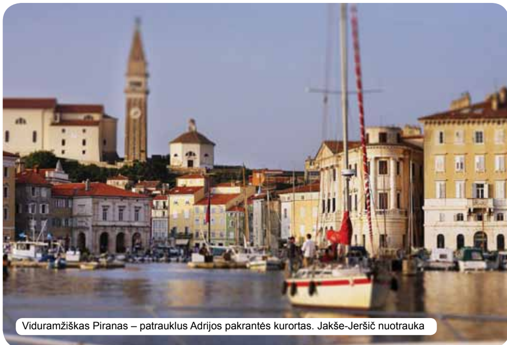
Viduramžiškas Piranas – patrauklus Adrijos pakrantės kurortas.