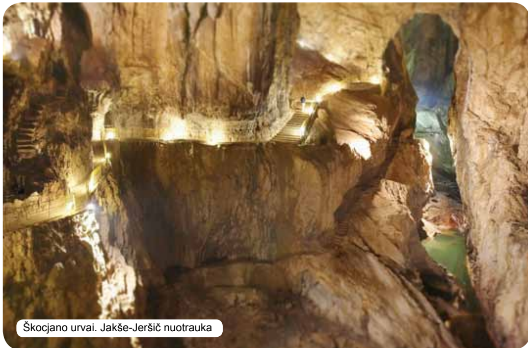
Škocjano urvai.