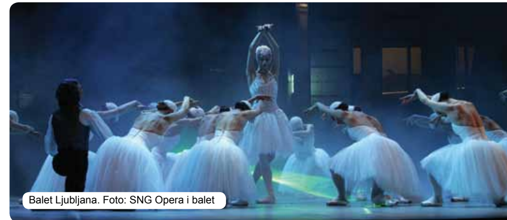
Balet Ljubljana.