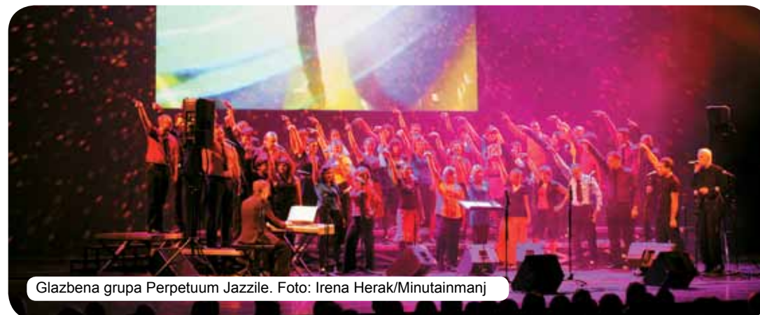
Glazbena grupa Perpetuum Jazzile.