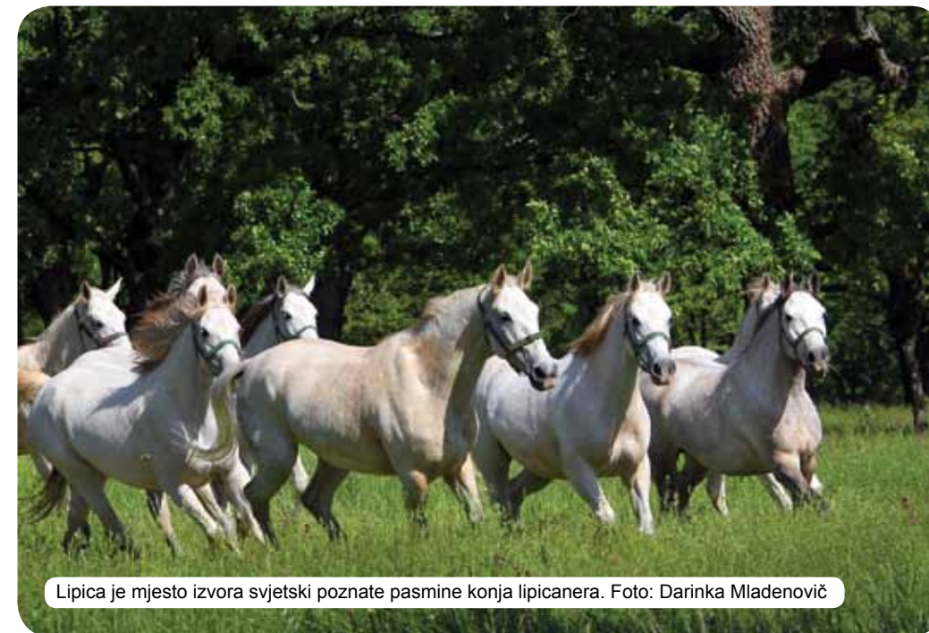
Lipica je mjesto izvora svjetski poznate pasmine konja lipicanera.