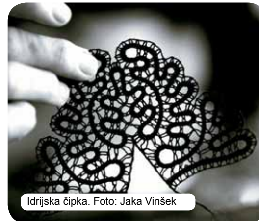
Idrijska čipka.