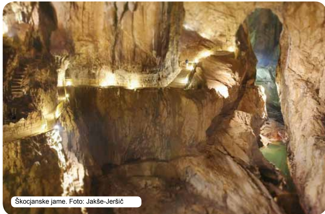
Škocjanske jame.