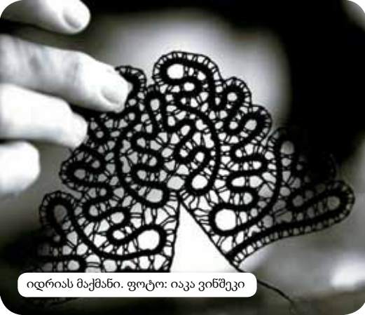
იდრასი მაცქანია.