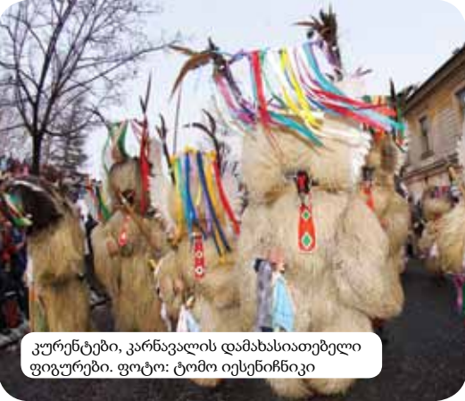
კურენტები, კარნავალის დამახასიათებელი ფიგურები.

უყვართ. გარდა თაობიდან თაობაში გარდამავალი სხვადასხვა უნარისა და ოსტატობისა, სლოვენიელები ასევე წარმატებით ფლობენ ყველა თაობისათვის ხელმისაწვდომ თანამედროვე ხელოვნების ფორმებს. საოცრად აქტიურია კულტურულ ღონისძიებებზე დასწრება – ახლი რაიონებიდან და შორიდან ჩამოსული სტუმრებისათვის იმართება სხვადასხვა ფესტივალები (განსაკუთრებით ზაფხულის თევებში). პოპულარულია თეატრი და კონცერტები. სლოვენიელებს უყვართ კითხვა და ისინი ამაყობენ თავიანთი კულტურული ტრადიციებით. აქვე უნდა ვახსენოთ სლოვენიური პოეზიის სიამაყე, პოეტი ფრანკე პერმერნი, სლოვენის ეროვნული ჰიმნის, Zdravljica -ს ავტორი. ჰიმნი ერების თანაარსებობისაკენ მოუწოდებს და არის zdravljica, ანუ ყველა კეთილი გულის ადამიანის სადღვერძელო.