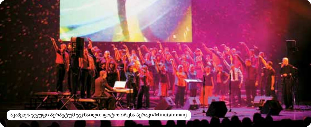
აკაპელა ჯგუფი პერაეტუმ ჯეზაილი.