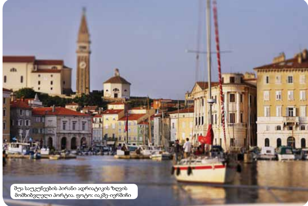
შუა საუკუნეების პირანი ადრიატიკის ზღვის მიმხიზბელები პორტია.

სლოვენის დევიზი „შევიგრძნოთ სლოვენია“ – გამოხატავს ბუნებასა და სლოვენიელთა შრომისმოყვარეობას შორის თანასწორობას; მასში ასახება ჩვენი ხელუხლებელი ბუნება და მისი დაცვის სურვილი. აქ ყურადღება გამახვილებულია სიმწვანეზე, რადგან ტყეები ქვეყნის ნახევარზე მეტს მოიცავს. სლოვენიაში მწვანე უფრო მეტს ნიშნავს, ვიდრე ფერი. ეს არის „სლოვენის სიმწვანე“, რომელიც ასახავს ბალანსს ბუნების სიმშვიდესა და სლოვენიელების ბუჯითობას შორის. ის მეტყველებს ბუნების ხელშეუხებლობაზე და მასზედ, რომ ჩვენ უდიდეს მნიშვნელობას ვანიჭებთ ბუნების დაცვას. ის ასახავს ცხოვრების სტილის დაბალანსებას, რომელშიც შერწყმულია სლოვენიელთა პირადი მოტივაცია და ერთიანი ხედვა იმის თაობაზე, რომ საჭიროა ბუნების დაცვა. „სლოვენის სიმწვანე“ მეტყველებს ჩვენს მიზანზე შევინარჩუნოთ ყოველივე ის ელემენტარული, რაც სლოვენიელთა ხელშია. ამავე დროს, ის მიუთითებს ადამიანის ხუთივე გრძნობის ჰარმონიაზე, რომელიც საჭიროა სლოვენის შესაგრძნობად. ამიტომ სლოვენის მოვლენებში რჩება არა მხოლოდ მისი წარმტაცი ხედები, არამედ ტყეების სურნელი, მოჩუჩუხე ნაკადული, წყლის საოცარი გემო და ხის სინაზე. ჩვენ ნამდვილად შეგვიძლია სლოვენის შეგრძნება.