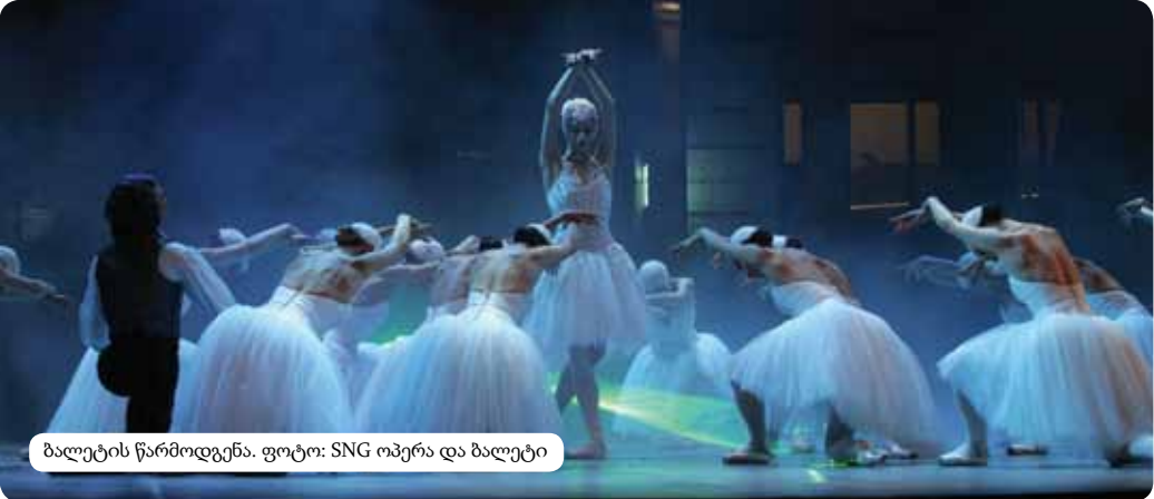
ბალეტის წარმოდგენა.