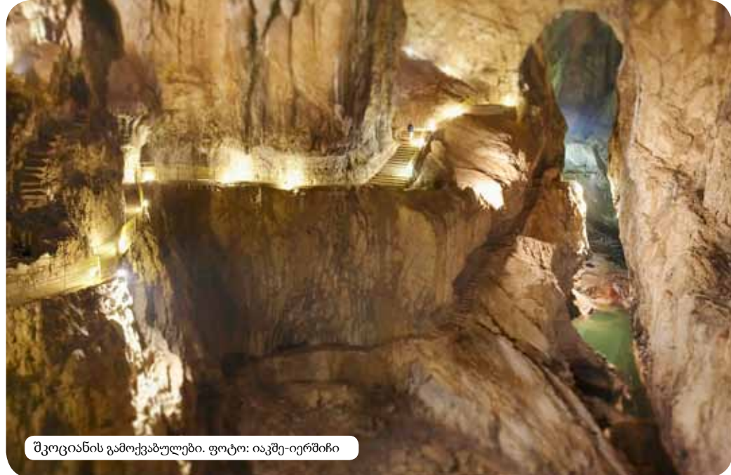
შკოციანის გამოქვაბულები.