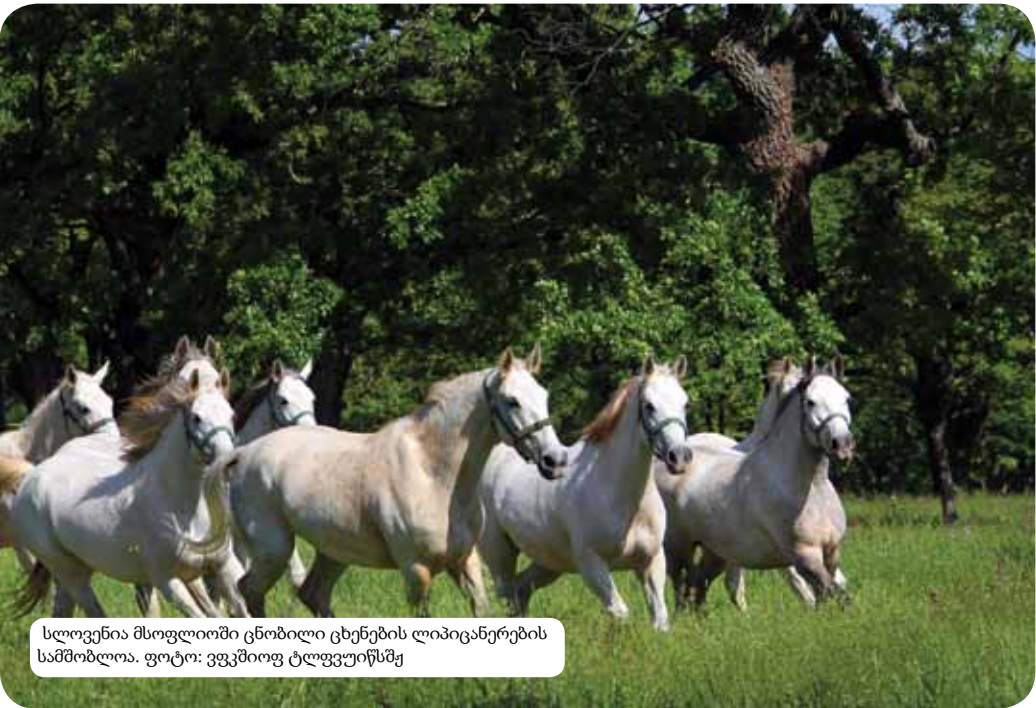
სლოვენია მსოფლიოში ცნობილი ცხენების ლიპიკანერების სამშობლოა.