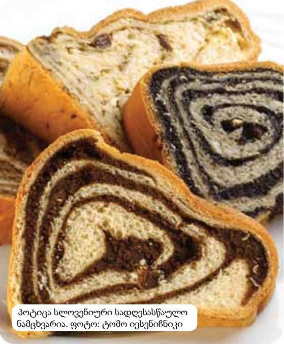
პოტიცა სლოვენიური სადღესასწაულო ნამცხვარია.

თანამედროვე სლოვენის კულინარია ალპური, ხმელთაშუაზღვისპირეთისა და შუა დუნაის რეგიონების კულტურისა და ციცილიზაციის ზეგავლენას განიცდის. ამ გასაფრში არსებულმა სოციალურმა და ისტორიულმა განვითარებამ ხელი შეუწყო განსაკუთრებული ტიპის კულტურისა და ცხოვრების სტილის, უნიკალური, ირიგინალური, მათ შორის კულინარული, ჩვევების ჩამოყალიბებას. ტრადიციული სლოვენიური სამზარეულო მოიცავს მარცვლეულს, რისი ახალ პროდუქტებს, ხორცს, თევზს, ბოსტნეულს, კარტოფილს, ზეთის ხილს და შაშხს. ის განიცდის სოფლის, ქალაქების და სხვადასხვა სამონასტრო საზოგადოებების ზეგავლენას, რეგიონის მიხედვით. სამზარეულოს გარდა, სლოვენის ღვინის საოცარი მრავალფეროვნება უდიდესი გურმანების გემოვნებას დააკმაყოფილებს. განცხრომის მოყვარულებს შეუძლიათ დატკვნენ ცხელი წყაროებით და გამაჯანსაღებელი კურორტებით, ტურისტული ფერმებით და უმაღლესი კლასის რესტორნებით.