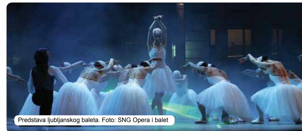
Predstava ljubljanskog baleta.