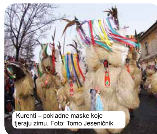
Kurenti – pokladne maske koje tjeraju zimu.

bloger, rezbar. Od svega što voli, Slovenac zna da napravi umjetnost. Osim kao stvaraoci u različitim domaćim radinostima i zanatima, koji se već stoljećima prenose s koljena na koljeno, Slovenci su uspješni i u mnogim savremenim umjetnostima dostupnim svim generacijama. Kulturne priredbe su izuzetno dobro posjećene – različiti festivali (posebno u ljetnim mjesecima) oduševljavaju posjetioce koji dolaze iz svih krajeva. Omiljene su pozorišne predstave i koncerti, a osim toga volimo čitati i ponosni smo na svoju kulturnu baštinu. Ovdje također treba pomenuti Franceta Prešerna, pjesnika i autora slovenske himne »Zdravljica« koji je postao ponos slovenske poezije. Himna poziva na suživot naroda i predstavlja zdravicu svim ljudima dobrog srca.