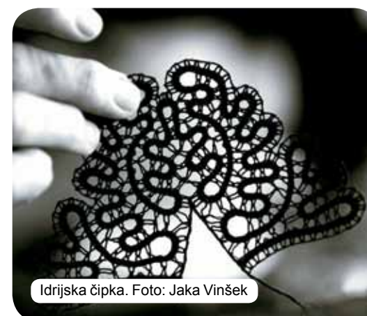
Idrijska čipka.