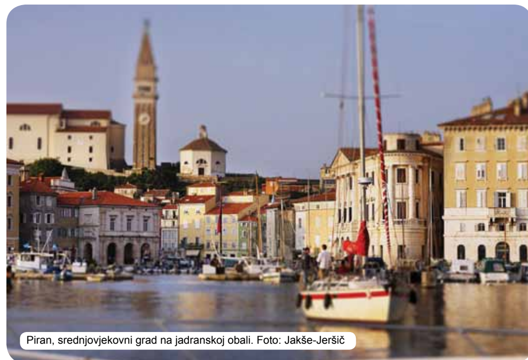
Piran, srednjovjekovni grad na jadranskoj obali.

Šume pokrivaju više od polovine države. Zelena boja u Sloveniji je zaista dominantna – »slovenska zelena« koja odražava ravnotežu između smirenosti prirode i marljivosti Slovenaca. Potvrđuje netaknutost prirode i naše opredjeljenje da takva i ostane. Simbolizuje uravnoteženost životnog stila koji objedinjava prijatnu uznemirenost koja prati Slovence u ispunjavanju njihovih ličnih želja uz zajedničku viziju da idu dalje ukorak s prirodom. Slovenska zelena također opisuje usmjerenost Slovenaca u elementarno, u ono što osjećaju vlastitim rukama. Slovenska zelena također govori o skladu svih čula kojima Slovenija može da se doživi. Zato se Slovenije nikada nećemo prisjetiti kao slike, jer sjećanja na Sloveniju sjedinjuju miris šume, žubor potoka, iznenađujući ukus vode i toplinu drveta. Sloveniju osjećamo.