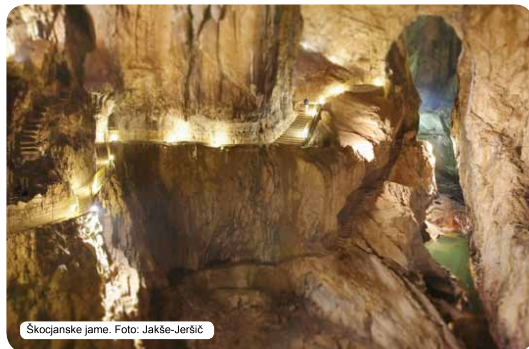
Škocjanske jame.