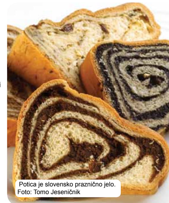
Potica je slovensko praznično jelo.

Tradicionalna slovenska kuhinja zasniva se na žitaricama, svježim mliječnim proizvodima, mesu, ribama, povrću, maslinama i pršutu. Zavisno od regiona objedinjava uticaje seoskih i gradskih sredina te različitih monaških redova. Vrhunska gurmanska zadovoljstva osigurava kako kulinarska slika tako i raznolikost slovenske vinske karte. One najprobirljivije također očekuju termalna vrela i banje, ponuda seoskog turizma i vrhunski restorani.