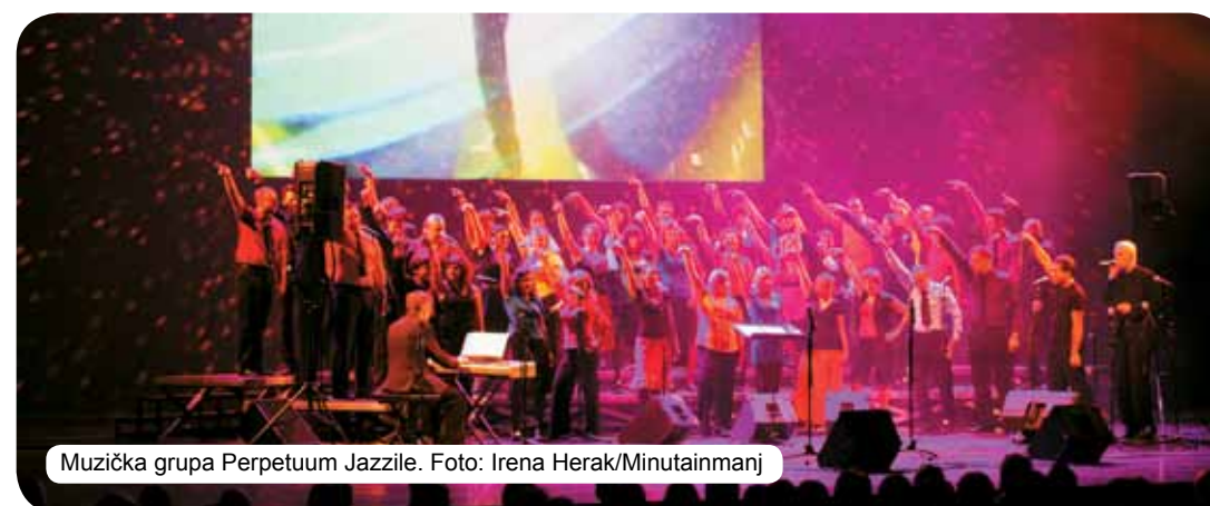
Muzička grupa Perpetuum Jazzile.