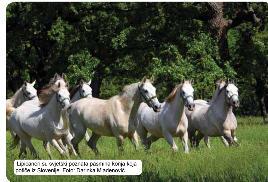
Lipicaneri su svjetski poznata pasmina konja koja potiče iz Slovenije.